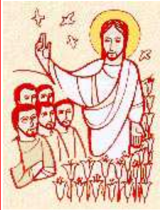
Guardate gli uccelli del cielo....

Foglio Parrocchiale - 2-9 Marzo 2014- 4 a Settimana del T. O.-Dal 5 Marzo:Le Ceneri - Quares.-