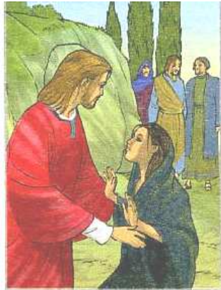
Quando Maria vide Gesù si gettò ai suoi piedi dicendogli: «Signore, se tu fossi stato qui, mio fratello non sarebbe morto».

Foglio Parrocchiale 6 - 13 Aprile 2014 - 5 a di Quaresima - Liturgia Ore: 1 a Settimana