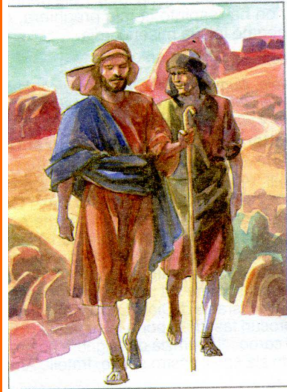
Il Signore designò altri 72 e li inviò a due a due

Foglietto Parrocchiale 07-14 Luglio 2013 - XIV a Sett. del T.O.- Liturgia Ore: 2 a Settimana