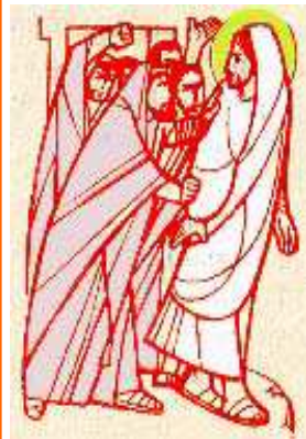
Si alzarono e lo cacciarono fuori della città.

Foglio Parr.le 3 - 10 Febbraio 2013 -Tempo Ordinario - Anno C- Liturgia Ore: 4 a Settimana