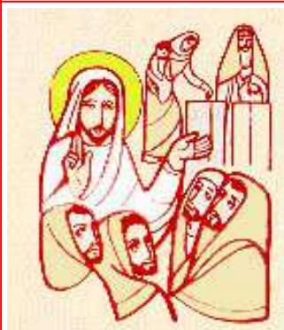
Lei..ha gettato quanto aveva

Foglio Parr.le 8 - 15 Novembre 2015 - XXXII a Domenica del T.O.- Liturgia Ore: 4 a Settimana