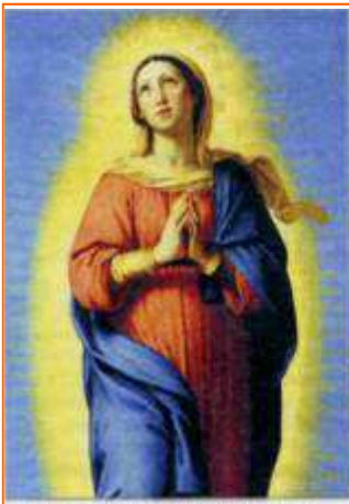
Maris è stata preservata dal peccato originale, perché piena di grazia fosse degna madre del Redentore.

Dal Libro della Genesi(3,9 -15.20) (Dopo che ebbe mangiato del frutto dell'albero,) il Signore Dio lo chiamò e gli disse: "Dove sei?". Rispose: "Ho udito la tua voce nel giardino:ho avuto paura, perché sono nudo, e mi sono nascosto". Riprese: "Chi ti ha fatto sapere che sei nudo? Hai forse mangiato dell'albero di cui ti avevo comandato di non mangiare?". Rispose l'uomo: "La donna che mi hai posto accanto mi ha dato dell'albero e io ne ho mangiato". Il Signore Dio disse alla donna: "Che hai