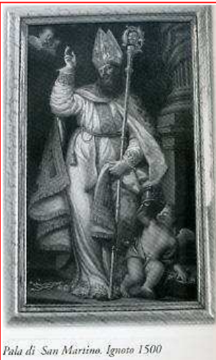
Pala di San Martino. Ignoto 1500

+ Dal Vangelo sec. Giovanni. (10,11-16) In quel tempo Gesù disse ai suoi discepoli: "Io sono il buon pastore. Il buon pastore dà la propria vita per le pecore. Il mercenario - che non è pastore e al quale le pecore non appartengono - vede venire il lupo, abbandona le pecore e fugge, e il lupo le rapisce e le disperde; perché è un mercenario e non gli importa delle pecore. Io sono il buon pastore, conosco le mie pecore e le mie pecore conoscono me, così come il Pa-