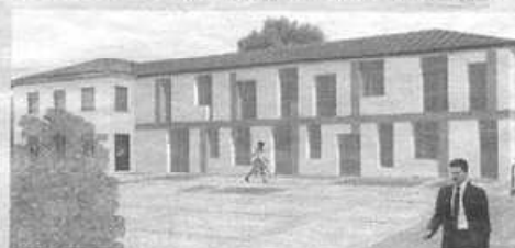
UN PROGETTO ALL'AVANGUARDIA - La nuova struttura consentirà di ospitare fino a 50 bambini