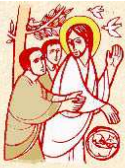
Tu sei il Cristo di Dio

+ Dal Vangelo secondo Luca (9,18-24) Un giorno Gesù si trovava in un luogo solitario a pregare. I discepoli erano con lui ed egli pose loro questa domanda: "Le folle chi dicono che io sia?". Essi risposero: Giovanni il Battista, altri dicono Elia; altri uno degli antichi profeti che è risorto".